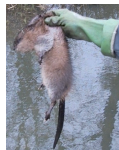
Se protéger avec des gants