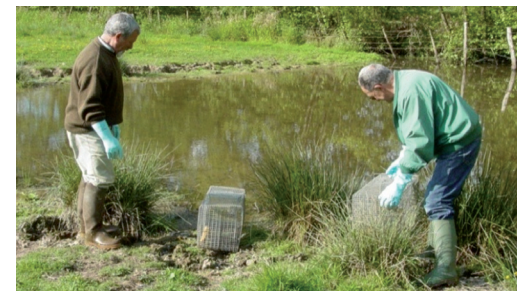
Une équipe de piégeurs avec leurs équipements de protection (gants et bottes)

La limitation du développement des rongeurs aquatiques en milieux rural participe à réduire fortement le risque de contamination.